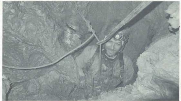
Dans le réseau des Crasseux

Revenons au Puits Choisy. Un passage « oublié » va nous mener jusqu'aux « Oubliettes » après un P8 et un P16 que l'on oubliera de nommer ! Ces puits donnent sur un nouveau passage étroit mais on sent bien qu'il se passe quelque chose derrière vu l'écho. Pour passer, il va falloir tirer ! Tirer le Roi ! La grande salle dans laquelle on débouche par un très esthétique P20 sera la salle de l'Epiphanie (si vous n'avez pas compris, à l'Epiphanie, on tire les Rois !).