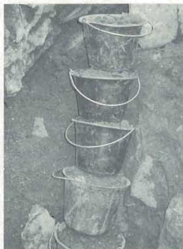
Désob en cours !

Donc ce nouveau trou sera le Fou pour le « Fou du Roi » : Le Fou du roi était une émission de radio animée par Stéphane Bern et ses « bouffons ». Et puis Roi, Reine, Fou.... font partie du jeu d'échecs mais nous, les Tachous du GSHP de Tarbes, on va gagner !